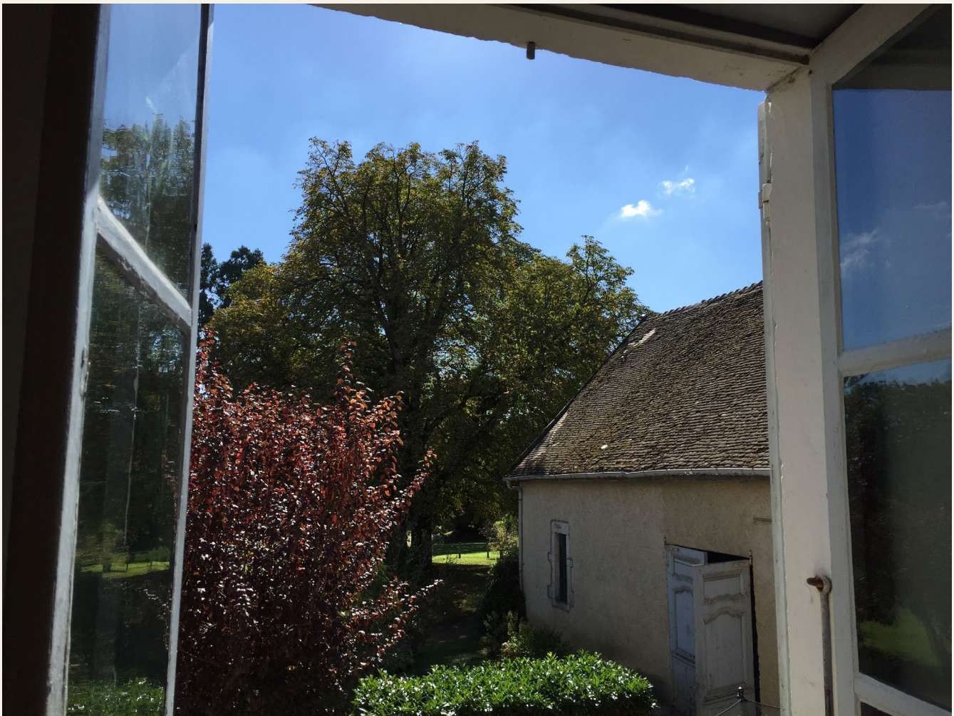
Fenêtre à partir de laquelle Nicéphore Niépce commence ses expériences en 1816.