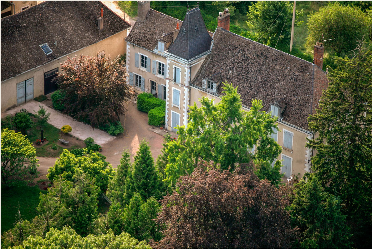
Vue aérienne de la propriété du Gras où fut inventée la photographie par Nicéphore Niépce en 1824.

C'est dans la maison d'habitation « du Gras », située à Saint-Loup de Varennes en Bourgogne, que Nicéphore Niépce a inventé et réalisé la première photographie au monde. Cette maison a été labélisée « Maison d'illustre » en 2013 par le ministère de la Culture.