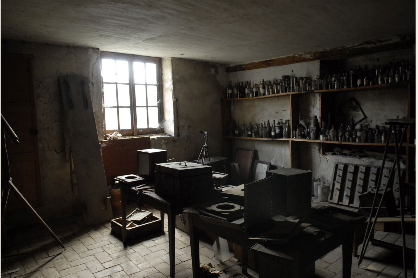
Laboratoire de J. Petiot-Groffier, tel qu'il fut découvert en 2007.

L'exposition présente plus de 100 photos de l'atelier de Joseph Fortuné Petiot-Groffier, le plus vieil atelier photographique du monde.