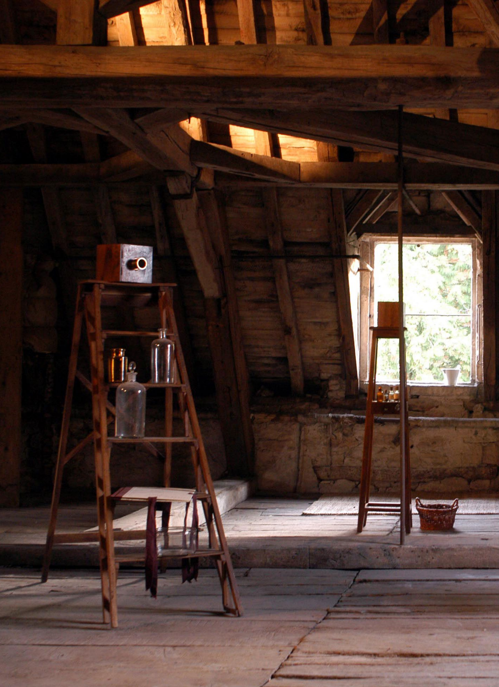
Grand grenier de la propriété du Gras, où Niépce et Daguerre firent de nombreuses expériences.