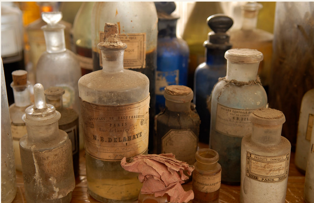
Flacons contenant les premières chimies photographiques découvertes dans le laboratoire de J. Petiot-Groffier.

Un ensemble exceptionnel qui permet pour la première fois d'entrer dans la chambre noire de l'un des tout premiers photographes de l'histoire. Depuis, cet atelier-laboratoire est conservé au sein de la Maison Niépce.