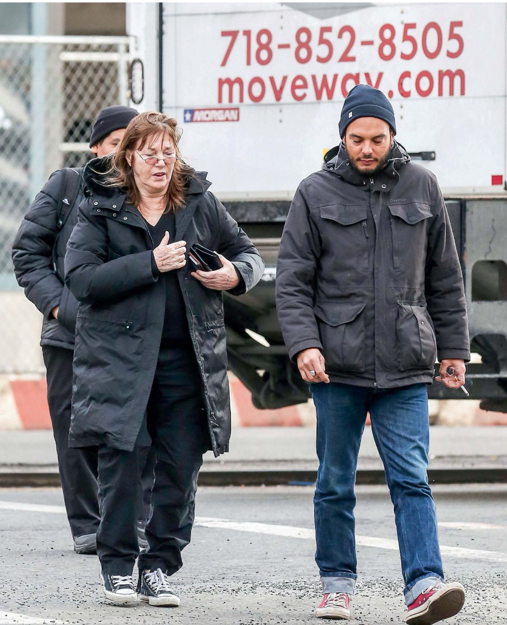
Avec sa grand-mère, à New York, le 29 janvier 2016.